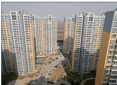
2017年,玉泉嘉苑安置6694名群众

办好民生实事。大规模开展职业技能培训,完善医疗卫生、居民医保、失业、工伤、低保、特困、优抚、退伍、救助等制度,做好民生兜底保障,累计发放各类社保待遇近1.9亿元。