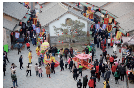
倒盖村民俗文化表演