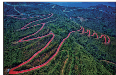
万安山国际自行车赛道