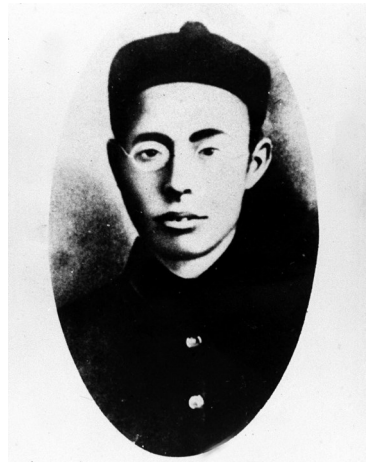
图为徐锡麟像