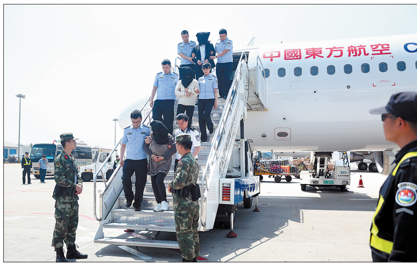
5名嫌犯被引渡回国

经我市公安机关侦查,自2012年1月起,这5名犯罪嫌疑人及赵某(在逃)在未经金融主管部门许可、不具备吸收存款业务资质的情况下,利用其实际掌握的黑石环球有限公司等公司名义,以年收益18%的高额利息为诱饵,承诺每月支付资产收益、到期支付本金,共向不特定公众387人非法吸收资金1.4亿元,未兑付资金9744万余元。案发后,6名嫌犯纷纷