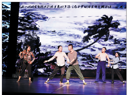
《军哥剧说》演出现场