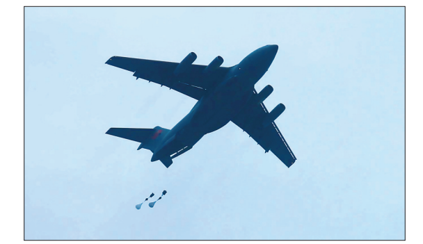
中国空军运-20飞机首次开展空降空投训练

中国空军大型运输机运-20与空降兵部队联合开展空降空投训练。中国空军新闻发言人申进科5月8日发布消息,中国自主发展的运-20大型运输机,近日首次与空降兵部队联合开展空降空投训练,这是中国空军战略投送能力、远程空降作战能力建设的又一次跃升。