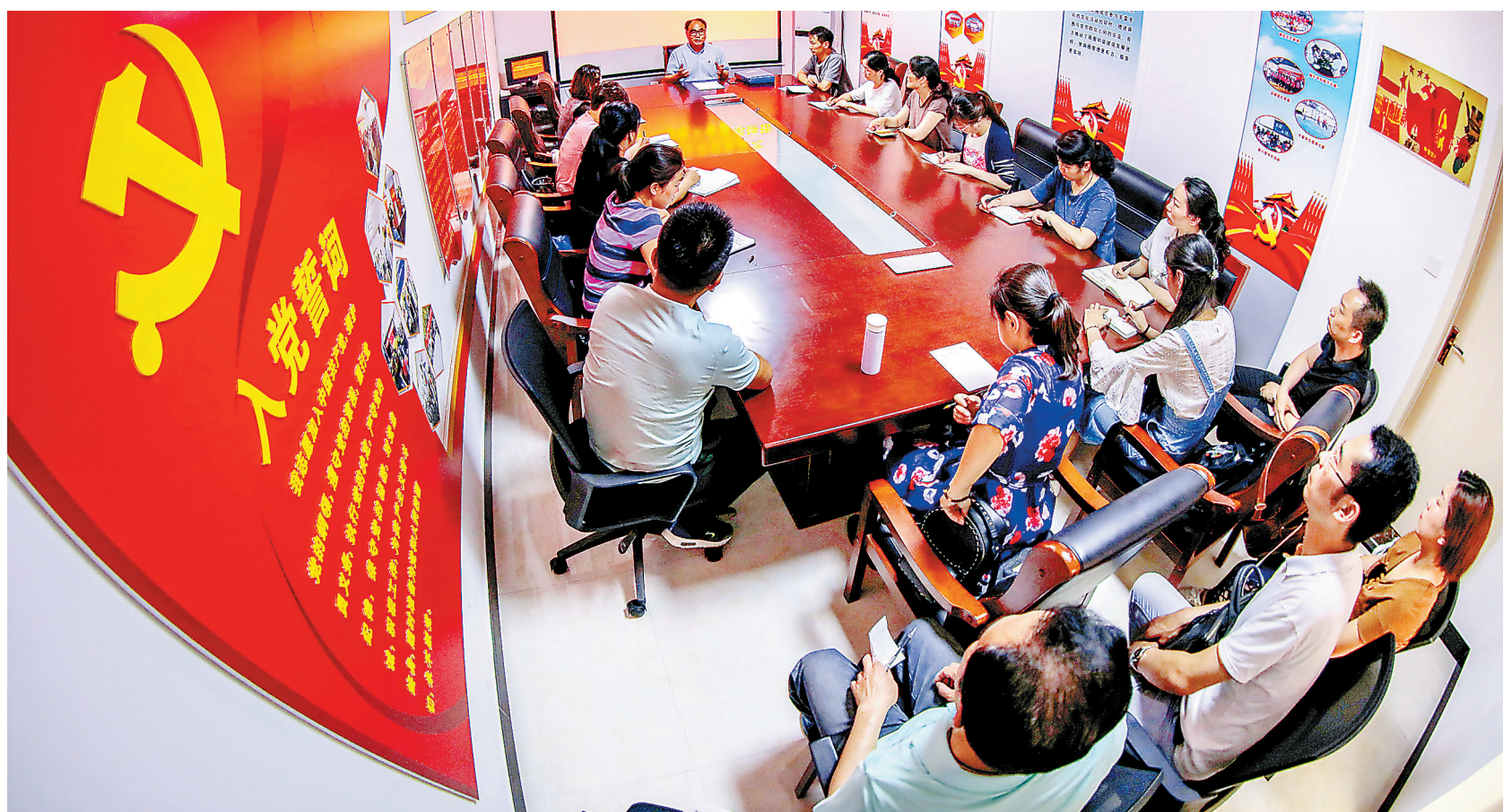
“红色引擎”促创新发展