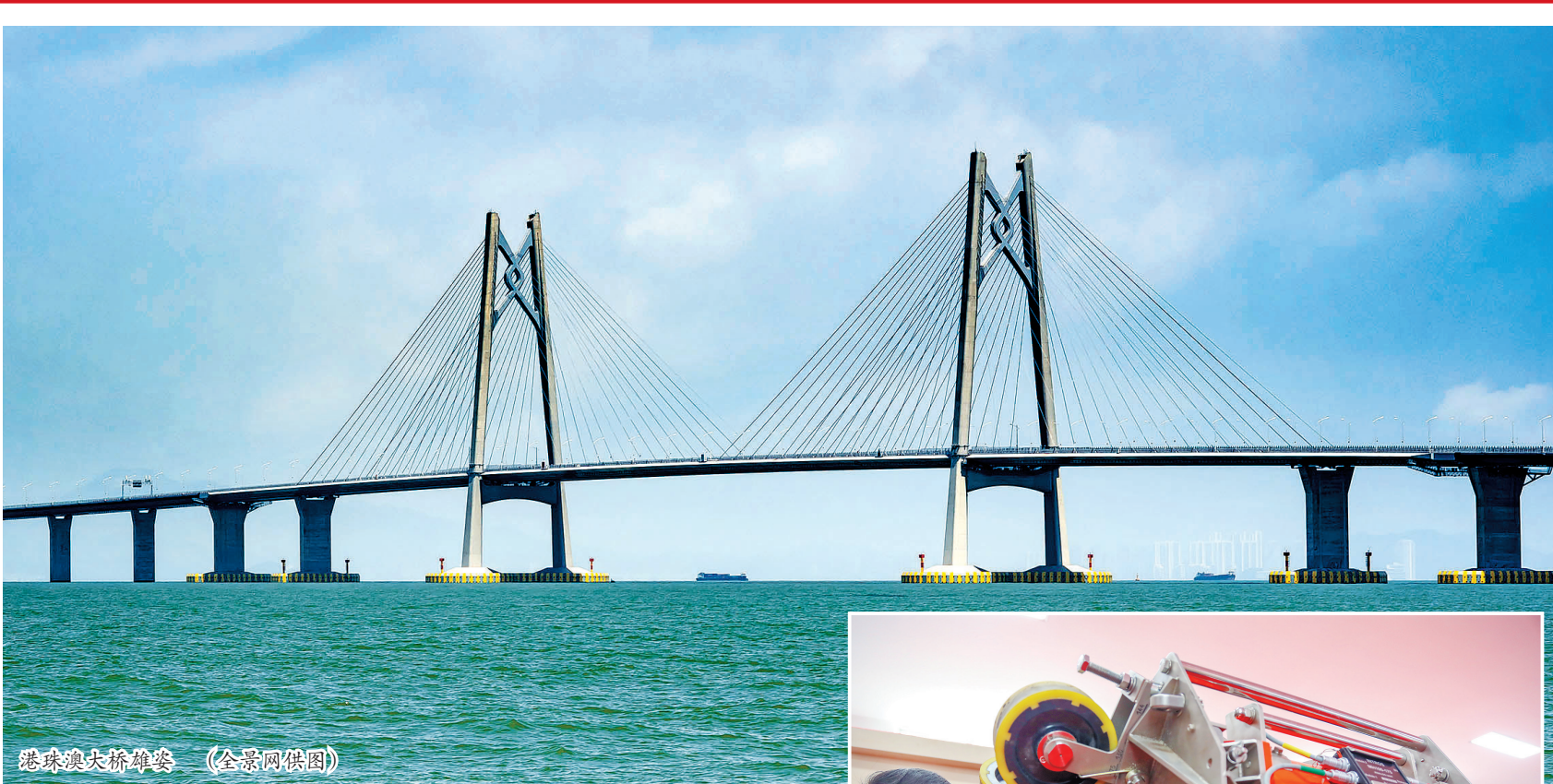
港珠澳大桥雄姿