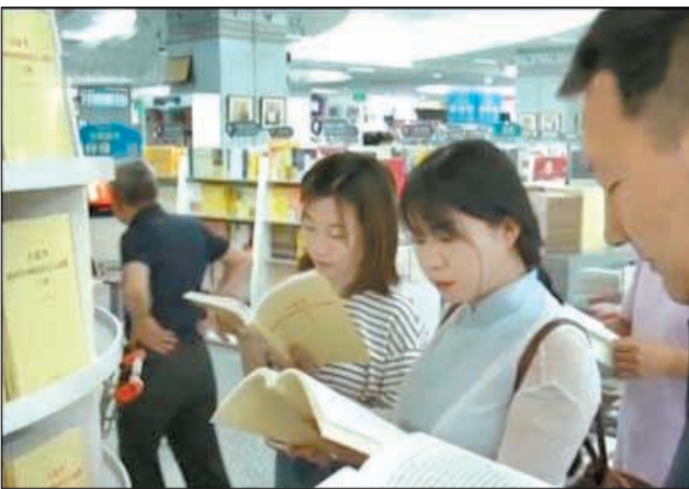
《三十讲》深受读者欢迎