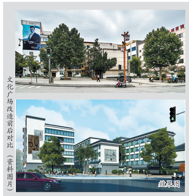
文化广场改造前后对比(资料图片)