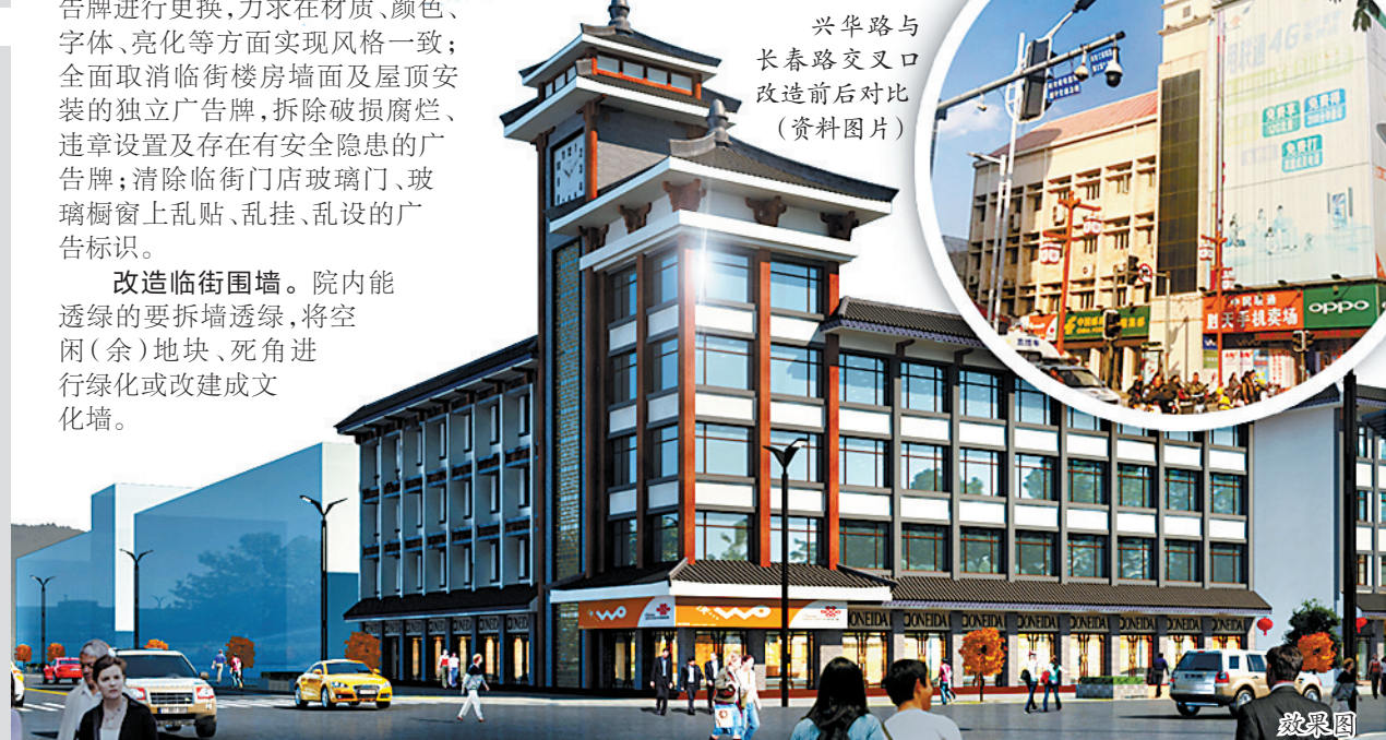
兴华路与长春路交叉口改造前后对比(资料图片)