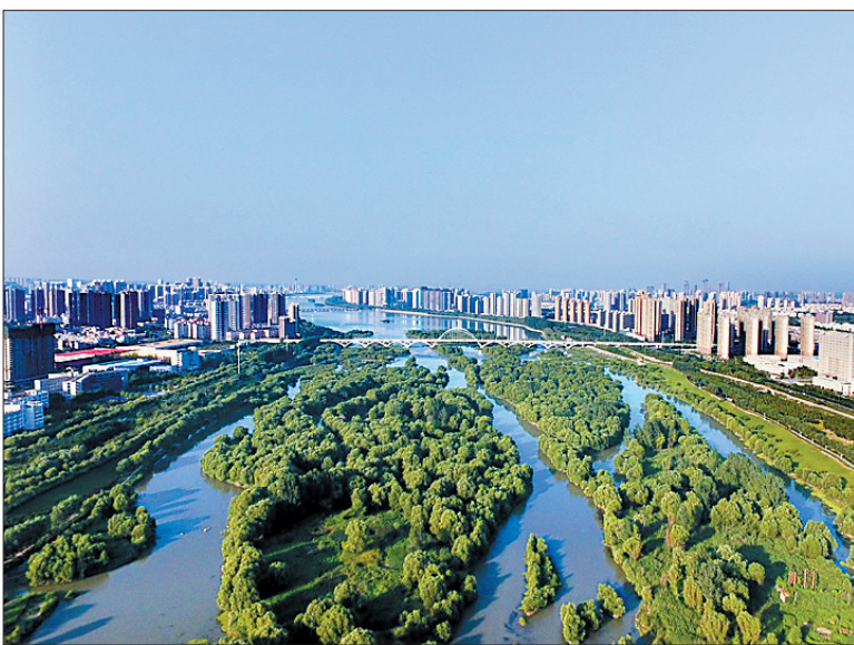
洛河市区段