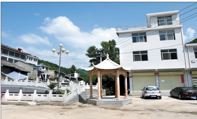
洛源镇小广场