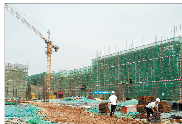
正在建设中的洛阳卷烟厂易地技改项目