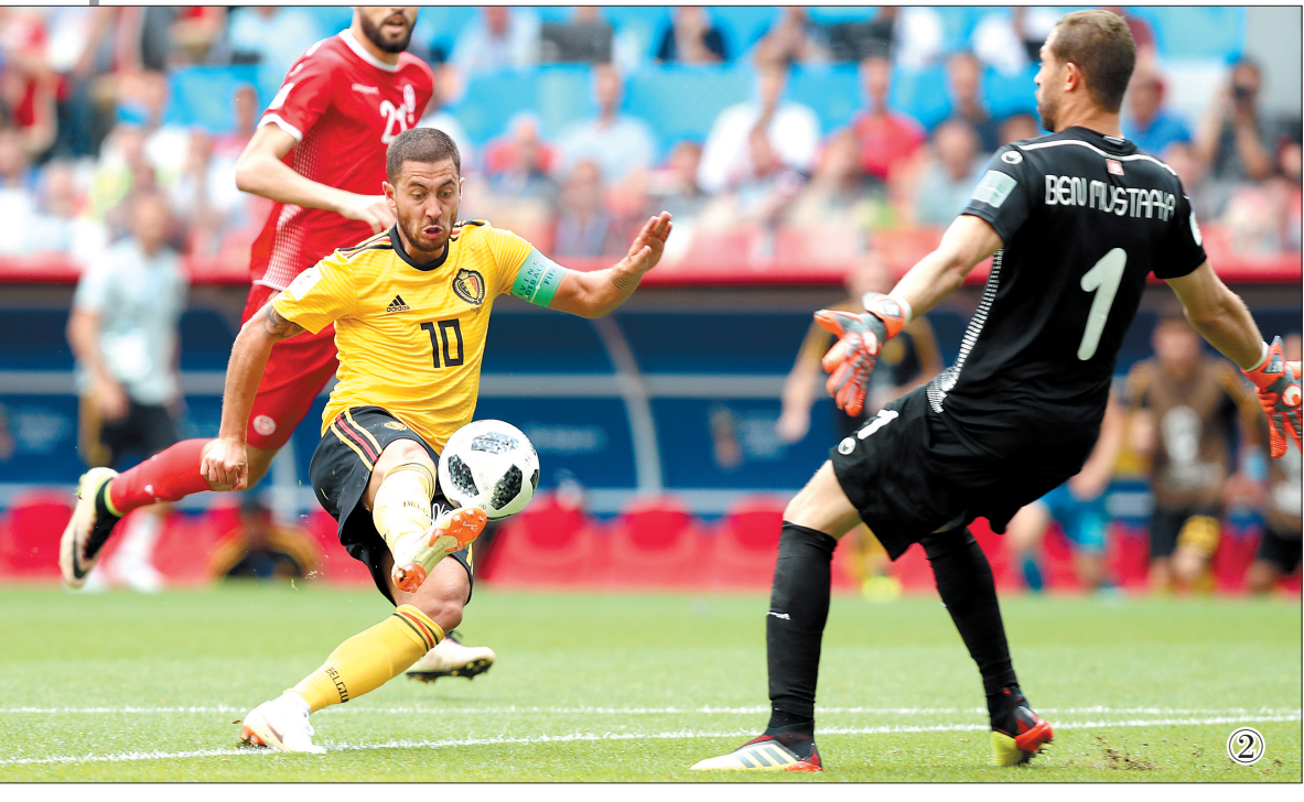
图① 6月20日,葡萄牙队球员罗纳尔多在比赛中庆祝进球。 图② 6月23日,比利时队球员阿扎尔(左)在比赛中射门。 图③ 6月21日,年仅19岁的法国队球员姆巴佩(右)在比赛中与队友格列兹曼庆祝进球。 图④ 6月21日,克罗地亚队球员莫德里奇在比赛中庆祝进球。 (本组图片均据新华社)