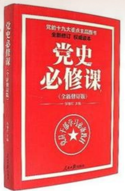
《党史必修课》 作者:张珊珍 出版社:人民日报出版社