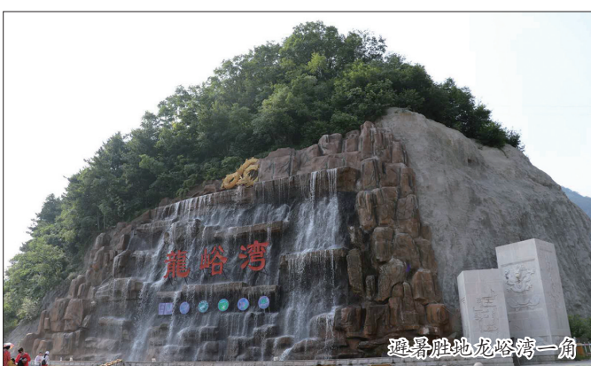
避暑胜地龙峪湾一角