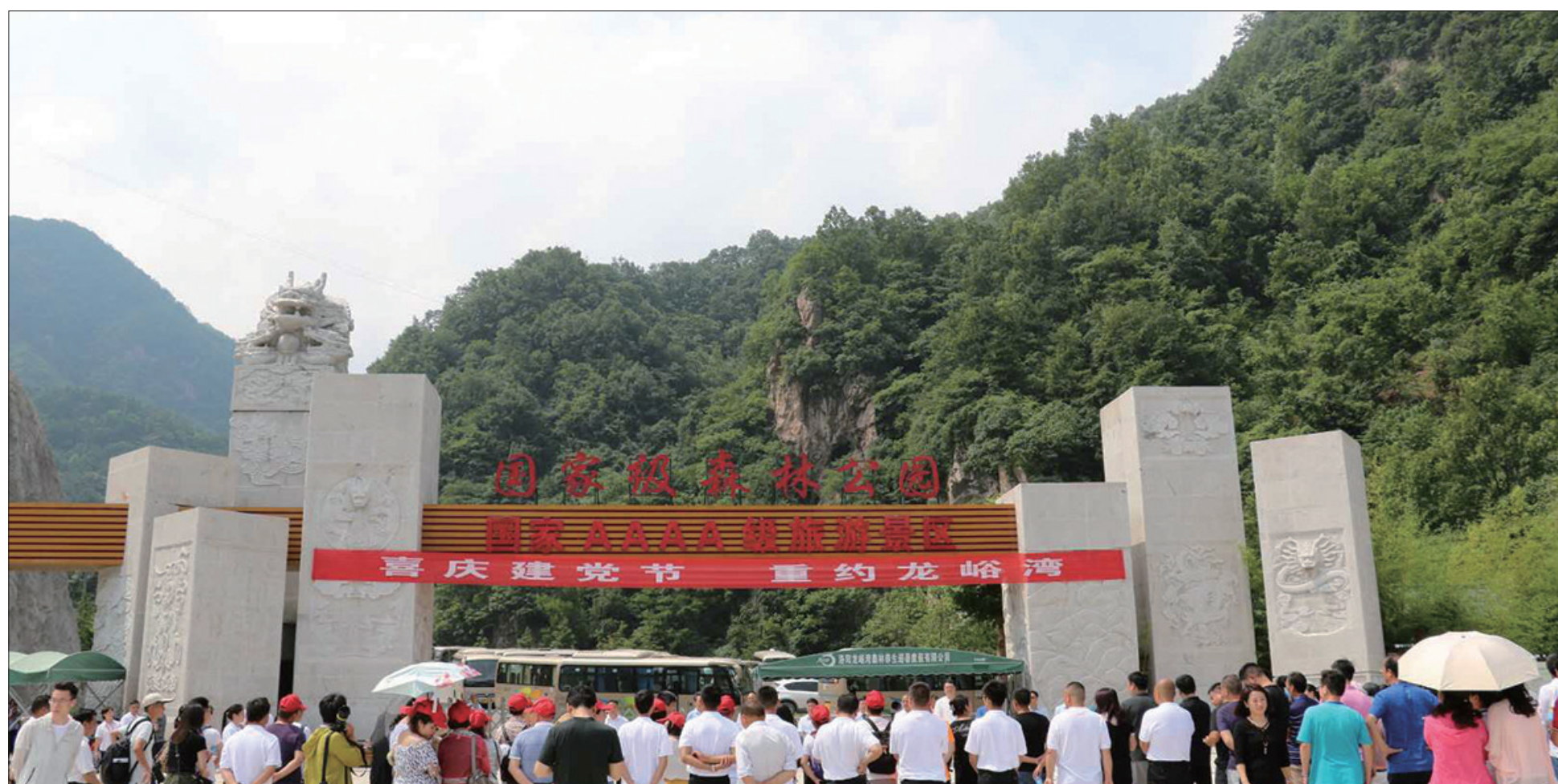
避暑胜地龙峪湾景区大门

峪湾景区,以实际行动为龙峪湾客流、名气、口碑、收益等再攀高峰作出了积极努力。他们抓党建、重宣传,严工程、勤营销,从景区硬件设施、运营管理、游客服务等方面全方位、深层次、多角度进行龙峪湾的改造提升工作,大力支持景区道路、步道、标识及部分景点改造提升,坚持打造一个风景秀丽、服务全面、产业兴旺的新龙峪湾,为我市增添一张亮丽的旅游新名片。