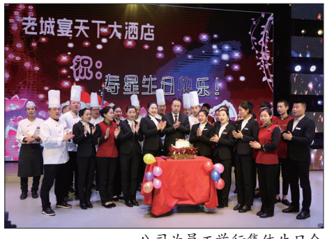
公司为员工举行集体生日会