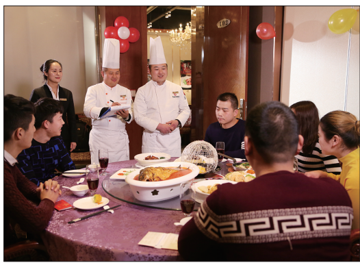
酒店厨师长当面征求顾客对菜品的意见