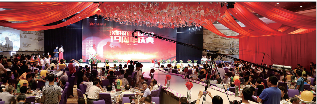
洛阳餐旅旗下水席园旗舰店宴会大厅

由于在践行“中国服务”方面成绩突出,洛阳餐旅被中国烹饪协会授予“中国服务十佳品牌”荣誉称号。