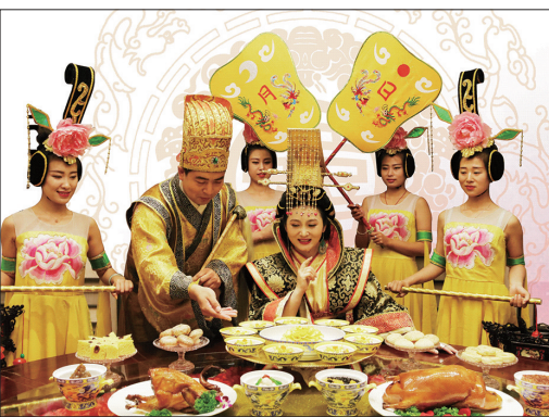
烤鸭、水席、红子鸡被誉为“餐旅三宝”

近年,随着电子商务、网上购物的不断繁荣,洛阳餐旅与时俱进,紧紧依靠“互联网+”,设置了公司网站和微信平台,同时开展团购业务,实现了点菜服务电子化、预订、收银信息化。这迎合了当下的消费方式,受到顾客欢迎。