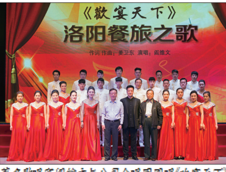
著名歌唱家阎维文与公司合唱团同唱《欢聚天下》