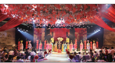
水席园旗舰店每天上演武皇盛宴