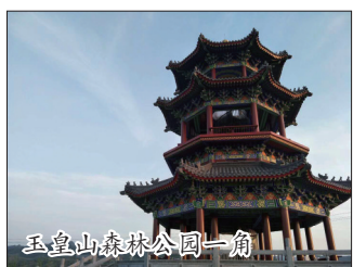
玉皇山森林公园一角