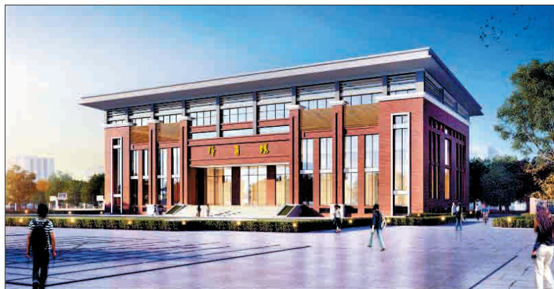
市实验中学厚载门校区体育馆效果图

18日,市城乡规划委员会2018年第八次会议召开,审议并原则通过了《洛阳大数据产业园控制性详细规划》《洛轴集团风力发电轴承、精密轴承及汽车轴承项目(轴承实验室单体)设计方案》《洛阳市实验中学厚载门校区体育馆设计规划方案总平面图及方案设计》《碧桂园天誉设计方案》等。本报今日继续对相关规划方案进行解读。敬请关注。