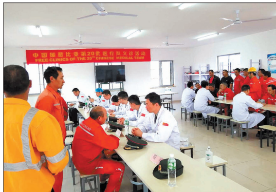
我市援助赞比亚医生为中国同胞义诊 (资料图片)