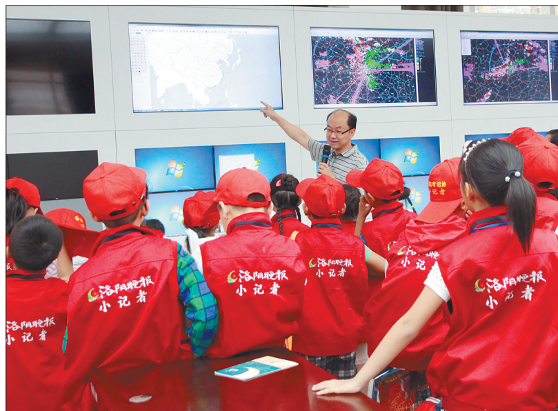
小记者走进“天气课堂”(往期活动资料图)