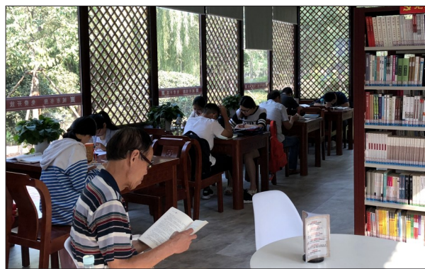
无人值守的城市书房内秩序井然

本报讯(记者 朱艳艳 通讯员 刘梦刚 张祺)12日清晨7时许,家住洛龙区长瑞C区的刘宗涛吃罢早饭,径直来到家门口小游园里的“河洛书苑”厚德苑城市书房,刷卡进门,开始阅读。