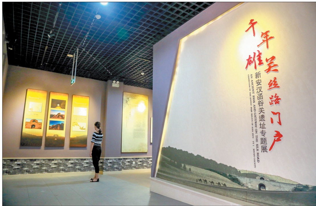
新安汉函谷关遗址专题展厅