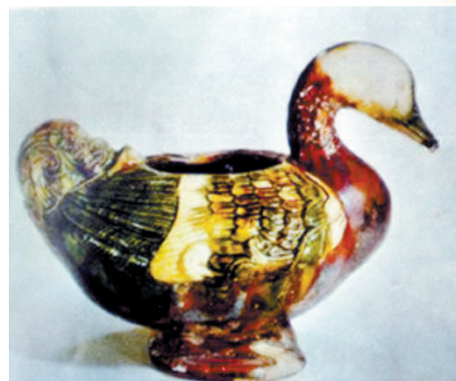
洛阳出土的唐三彩鸳鸯壶 (资料图片)

都畿道是大唐帝国的物流中心,也是手工业中心,在此设少府监、军器监、将作监三个手工业管理部门,建立了规模庞大的手工业工场。据《新唐书·百官志》记载,洛阳城有“短蕃匠五千二十九人”。所谓“短蕃匠”,指服役的短期工匠。手工业工场中最多的是奴婢,还有国家招聘的长工匠、和雇匠、明资匠等技术工匠。