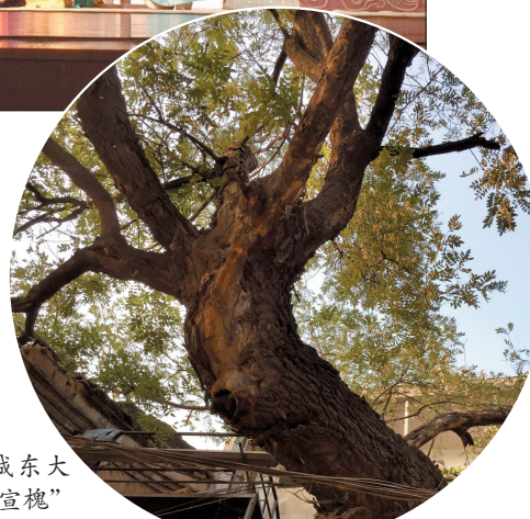
老城大街的“董宣槐”

东汉建立后，光武帝命人颁布了很多律法，这些律法对老百姓的约束力非常大，可是皇亲国戚和一些有功的大臣仗着自己的权势，一点儿也不把律法放在眼里，很多人像湖阳公主一样，纵容自家子弟和奴仆横行街市，作威作福。就像曲剧《洛阳令》里说的：“京都洛阳，案件频发。”为了惩治不法、整顿秩序，朝廷连换几任洛阳县令，仍控制不住局面。在此情况下，光武帝刘秀才决定任命刚正不阿、执法严厉的董宣为洛阳令。