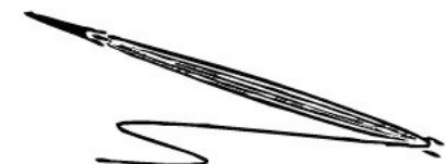
用于织网儿的铜制缠线梭子