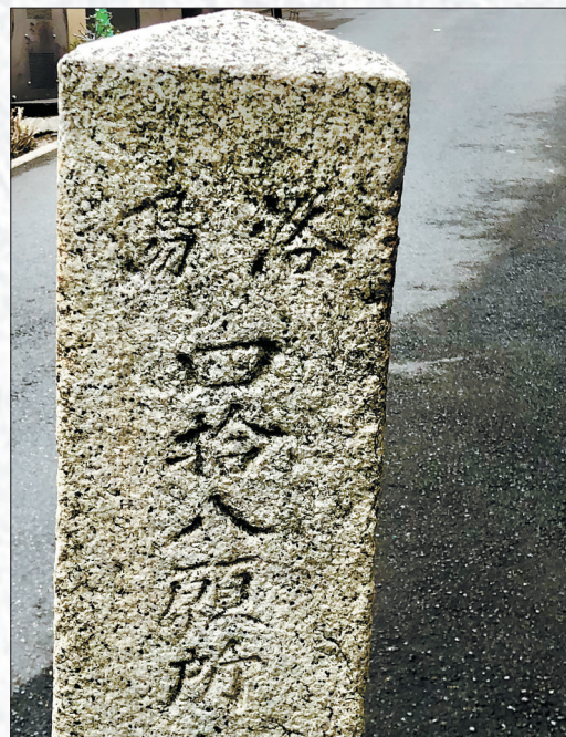
京都街头刻有“洛阳”的石碑