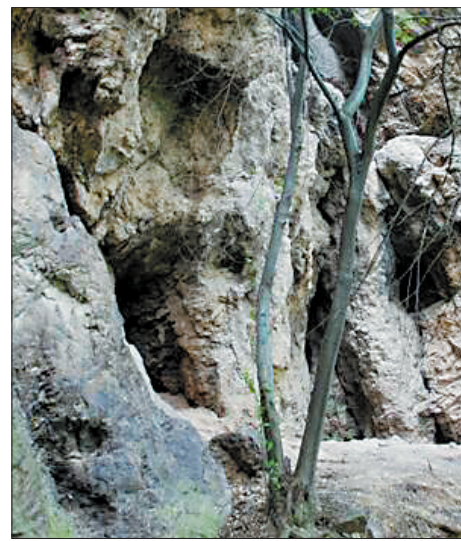
汤营石辟缝遗址外景

汤营石辟缝遗址位于栾川县潭头镇汤营村汤营小学后方,长约6米,宽约2.5米,海拔521米。