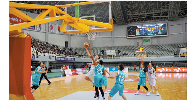
27日晚,2018—2019赛季WCBA联赛第四轮较量,河南伊川农商银行女篮在市体育中心体育馆主场迎战卫冕冠军北京首钢女篮,最终以69:73遗憾告负。今日19时30分,河南女篮迎战天津女篮,广大球迷可到市体育中心体育馆观战。

本报讯(记者 朱艳艳 通讯员 王施展)第七届河南省专业声乐器乐大赛“文华奖”暨第四届河南音乐“金钟奖”评选活动近日在郑州落幕,我市选手获得佳绩,其中2名选手荣获一等奖。本届大赛是河南省专业声乐器乐大赛“文华奖”与河南音乐“金钟奖”评选首次合并举行,也是我省首个由省文化厅、省文学艺术界联合会、省教育厅三家联合主办的专业音乐类大赛,是专业声乐器乐的省级最高赛事。比赛分为综合组和高校组,全省共有449名选手参与角逐。经过6天的激烈比赛,我市文广新局、市音乐家协会选送的李烽荣获综合组流行音乐一等奖,洛阳师范学院选送的夏文超荣获高校组美声一等奖。此外,还有5名选手获得二等奖,11名选手获得三等奖,市文广新局获得优秀组织奖。