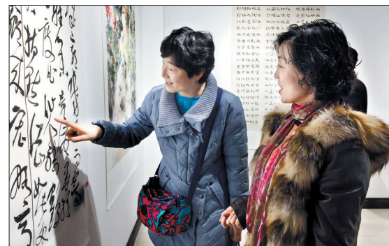
“洛风邗韵”洛阳扬州书画联展开展

陆浑戎是2600多年前的神秘古国,最早活动于今西北瓜州一带。公元前638年,陆浑戎迁至洛阳伊洛川地,是一个较早定居于中原腹地的西北游牧民族政权。2013年以来,市文物考古研究院在伊川县鸣皋镇徐阳村对陆浑戎墓地进行了大面积的调查、勘探、发掘,共发现墓葬300余座、车马坑15座,还发现有灰坑、烧窑等。该墓葬群的发现印证了陆浑戎的迁徙、灭国等历史事件,为研究中原地区民族迁徙与融合提供了重要依据。