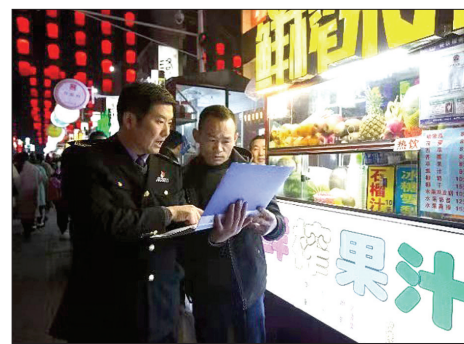
青年宫监管所监管人员对十字街夜市商户进行检查指导

每当夜幕降临,来洛阳老城十字街夜市上寻觅美食的人络绎不绝。细心的市民会发现,这里的小吃摊全都换上了规格统一、外观漂亮的餐车、灯牌,并且增添了油烟净化设施,展现出提质上档整改后的新形象。