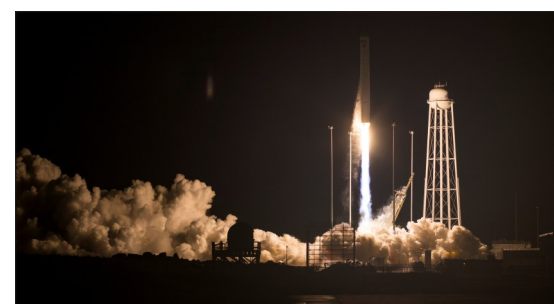
美货运飞船升空前往国际空间站

11月17日,在美国东海岸弗吉尼亚州的瓦勒普斯航天发射场,美国诺思罗普-格鲁曼公司利用“安塔瑞斯”火箭发射“天鹅座”飞船。该公司17日利用“安塔瑞斯”火箭发射“天鹅座”飞船,第十次执行国际空间站货运任务,共送去近3.4吨物资和实验设备。