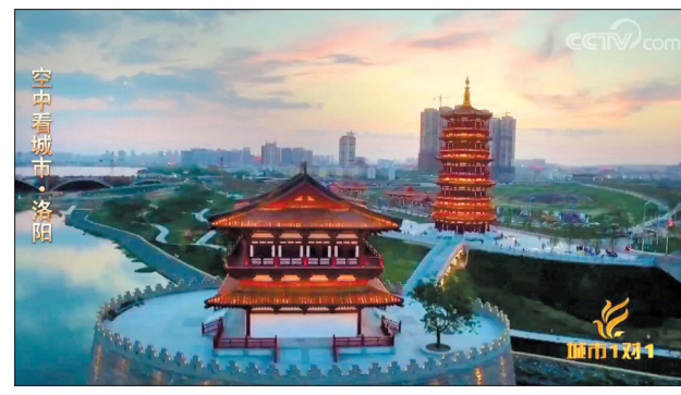
节目视频截图 (资料图片)

本报讯(记者 朱艳艳)2日,中央电视台中文国际频道《城市1对1》栏目播出了《瑰丽古城 中国洛阳—捷克布拉格》节目。洛阳和布拉格,两座古城在电视荧屏上进行了深度对焦和魅力展示。