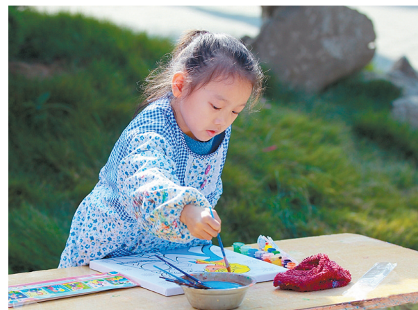
描画 慕阳客 摄