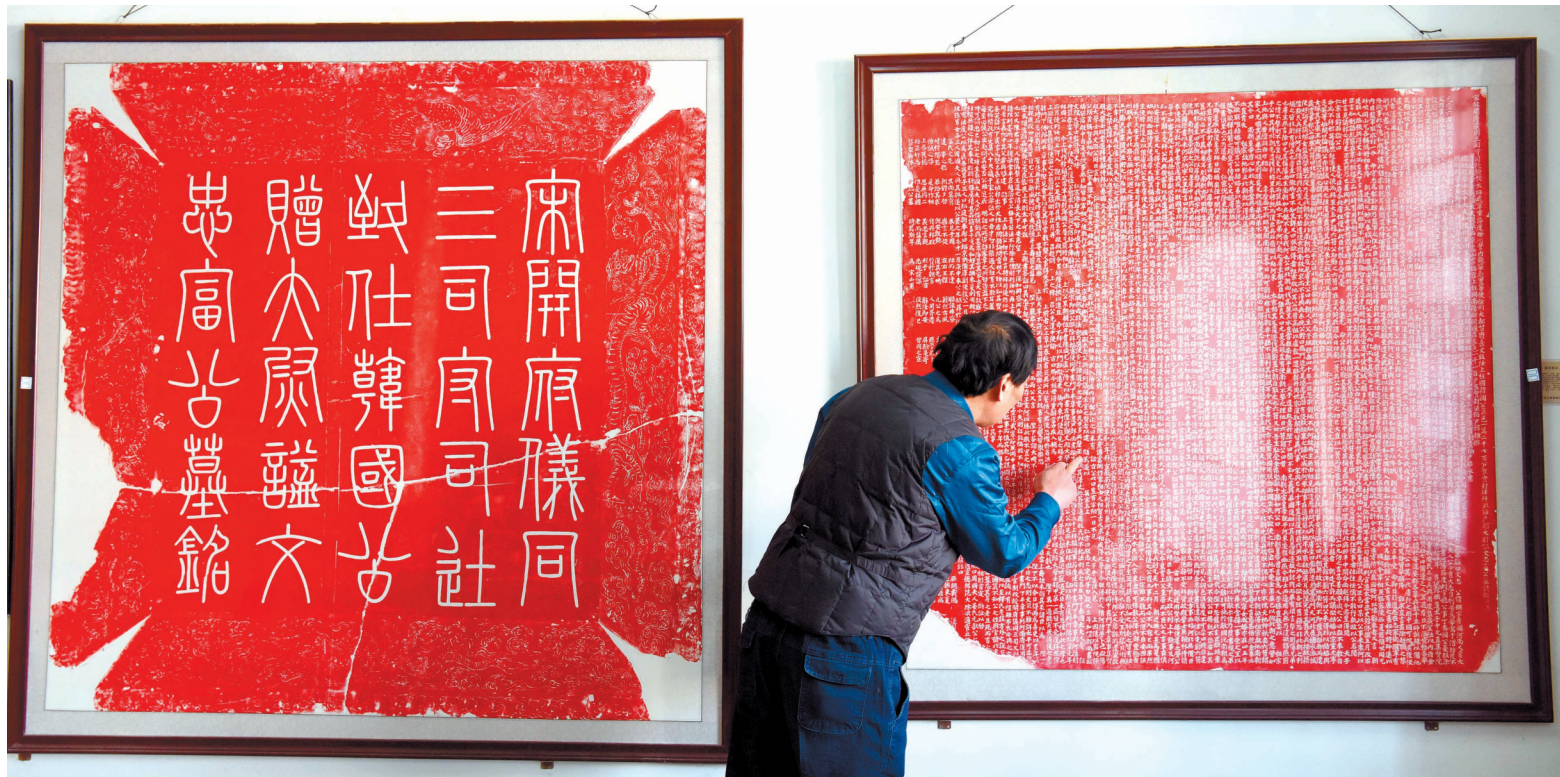
北宋富弼墓志拓片