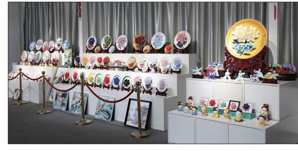
李学武牡丹瓷国礼展厅