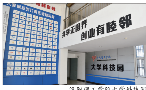
洛阳理工学院大学科技园