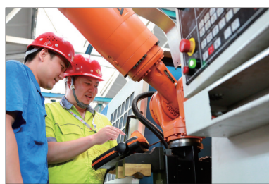
地企合作研发“金石机器人”