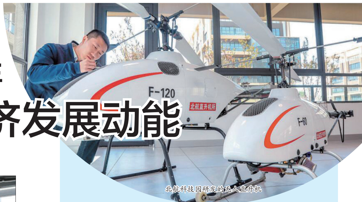
北航科技园研发的无人直升机