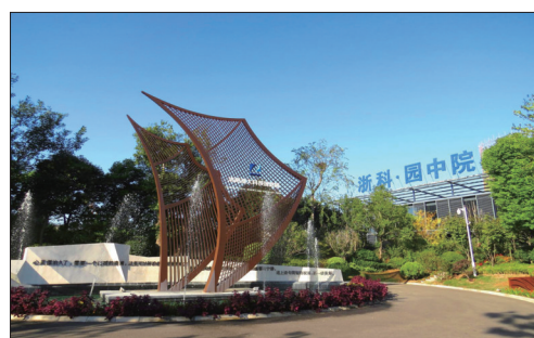
洛阳浙大科技创意园