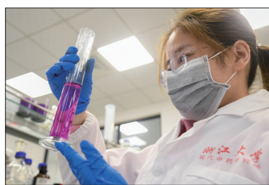
洛阳泽达慧康的中药检测分析环节