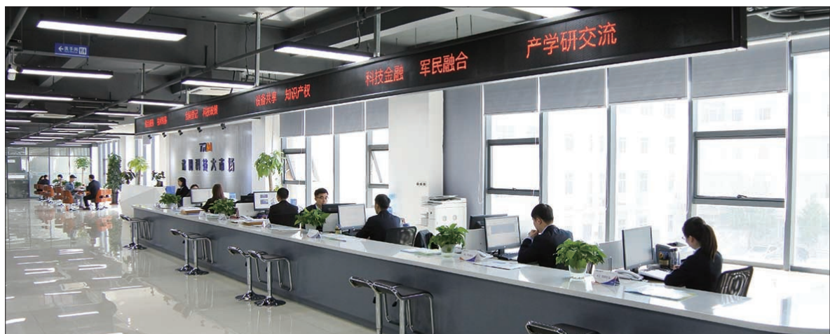
洛阳科技金融大市场综合服务大厅