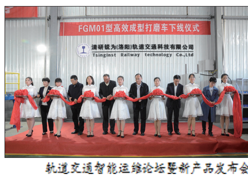
轨道交通智能运营论坛暨新产品发布会