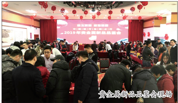
贵金属新品品鉴会现场

近日,为感谢新老客户一直以来对中行洛阳分行的支持,该行举办了“2019年新春金玉满堂 金猪送福贵金属新品品鉴会”,共有客户200余人参加。活动中,丰富的产品、新颖的款式、精湛的技术工艺和较高的收藏价值满足了客户对贵金属产品的投资和品鉴需求。客户在各个展台前精心挑选、购买心仪的产品,成交后的砸金蛋环节更是砸出了获得精美礼品的喜悦,品鉴会现场充满热烈欢快的气氛,活动受到到场客户的好评和肯定。