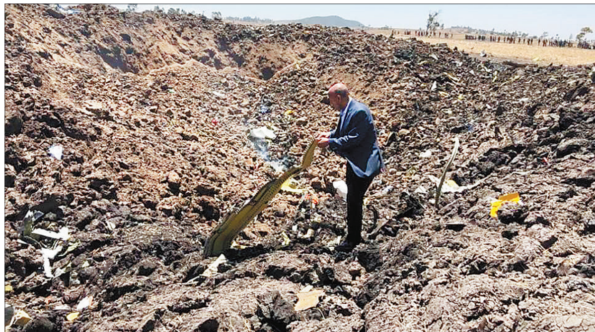
3月10日,在埃塞俄比亚首都亚的斯亚贝巴附近,一名男子查看坠毁客机的残骸

埃塞俄比亚航空是在非洲国家航空公司中运营效益较好的一家航空公司,也是近年发展较快的一家航空公司。