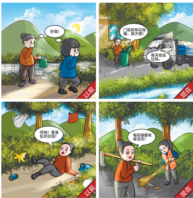
新华社发 张丹 作