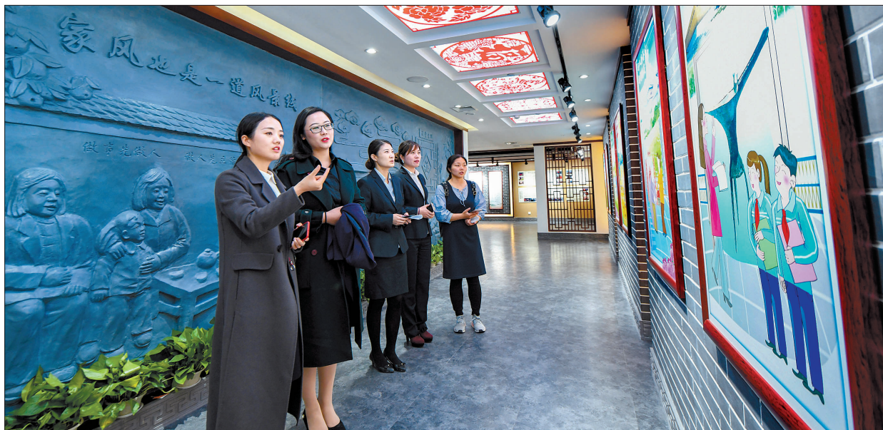
市民在河洛家风家训馆参观

作为拥有全国文明城市、全国双拥模范城等响亮的历史文化名城,我市始终坚持大力弘扬社会主义核心价值观,深耕文明厚土。截至去年,我市中心城区建成社会主义核心价值观主题广场、游园20个,主题街道10条,核