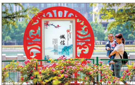
街头游园风景