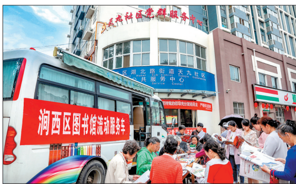
“流动图书馆”进社区