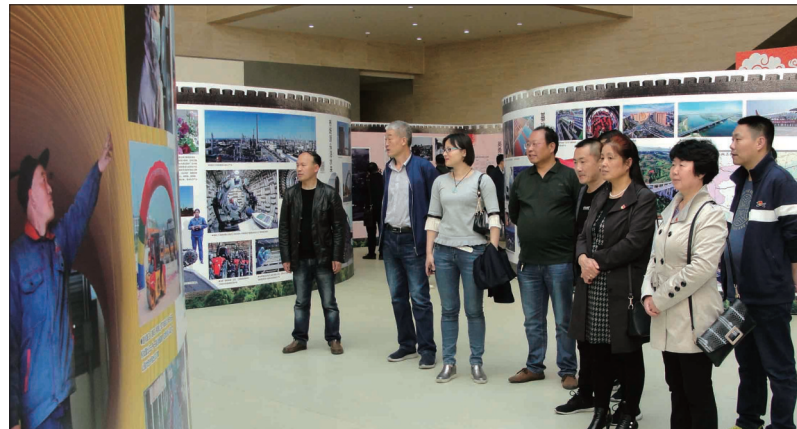
参观纪念洛阳解放七十周年成就展