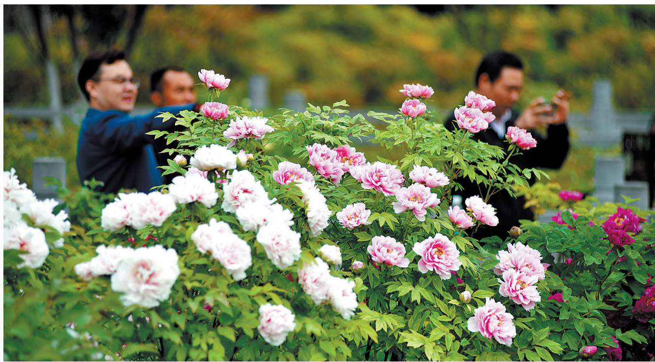
昨日,王城公园牡丹仙子观赏区花开正艳

全园有20个品种约2000株牡丹开放。人工调控花期牡丹有洛阳红、紫香秀色、百园红霞等品种盛开;露地自然花期