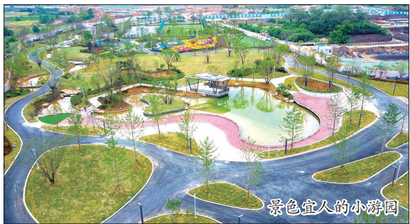
景色宜人的小游园