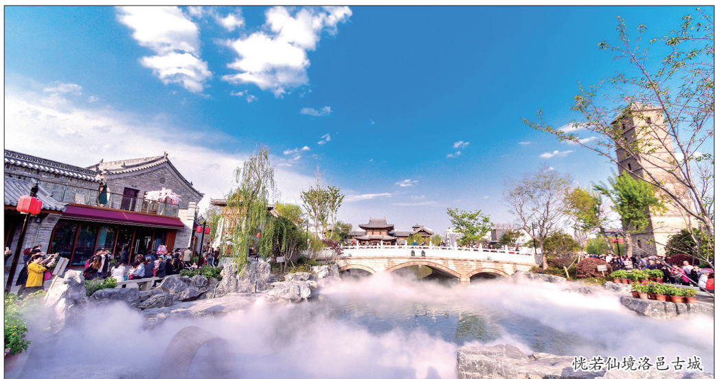
恍若仙境洛邑古城

洛阳市老城区位于城市区中东及北部,总面积56.7平方公里,辖9个街道办事处、11个行政村、37个社区居委会,总人口约20万。走进四月的老城,春潮涌动,万物竞发,处处散发着勃勃生机。洛邑古城、民主街古色古韵,东西大街、兴华街游人摩肩接踵,特富特科技(深圳)有限公司洛阳生产基地、万景祥牡丹产业园产销两旺……老城正以独特的区位优势、丰富的发展商机和开放创新的无限活力,成为企业客商投资兴业的沃土。