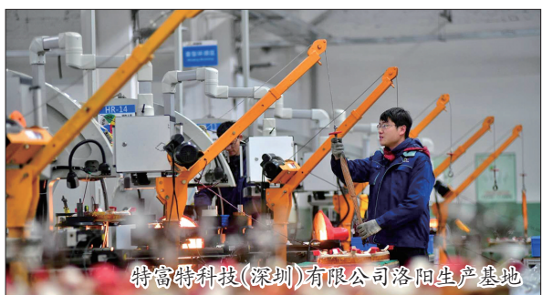
特富特科技(深圳)有限公司洛阳生产基地