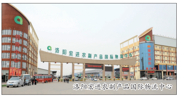
洛阳宏进农副产品国际物流中心