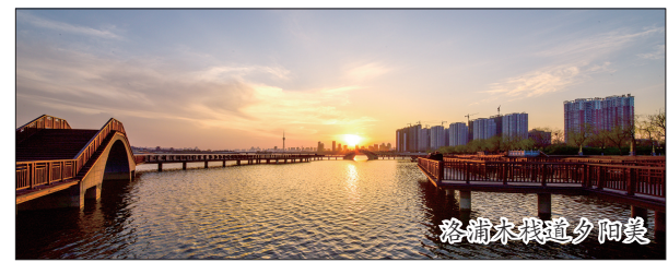
洛水河畔道乡陶景

奋进正当时 筑巢引凤来 古朴厚重、开放包容、充满活力的老城诚邀有识之士前来投资兴业,共创未来!老城区将以更加强劲的态势、开放的胸襟、优质的服务、优良的环境为广大投资者营造发展沃土,携手共建文化老城、智慧老城、活力老城、品质老城、幸福老城! (老城宣)