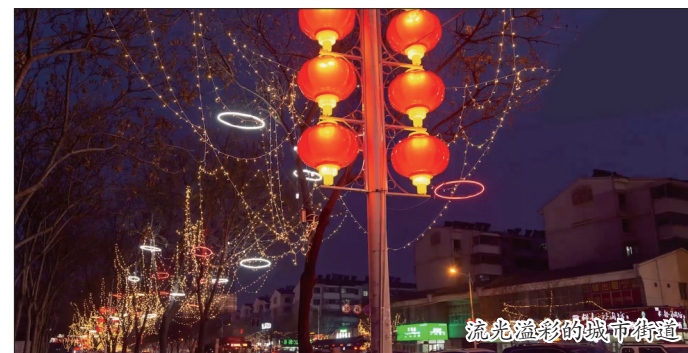
流光溢彩的城市街道

优化环境完善服务。该区通过多种形式,加强城市基础设施建设,加大环境整治力度;不断健全社会治安防控体系,加强对重点区域尤其是企业周边治安环境的管理和整治,严厉打击盗窃、敲诈、勒索等违法犯罪活动,严肃查处无理刁难、阻碍施工等不法行为,依法保护外来投资者的合法权益,为投资者创造舒心的生活环境和安心的创业环境。