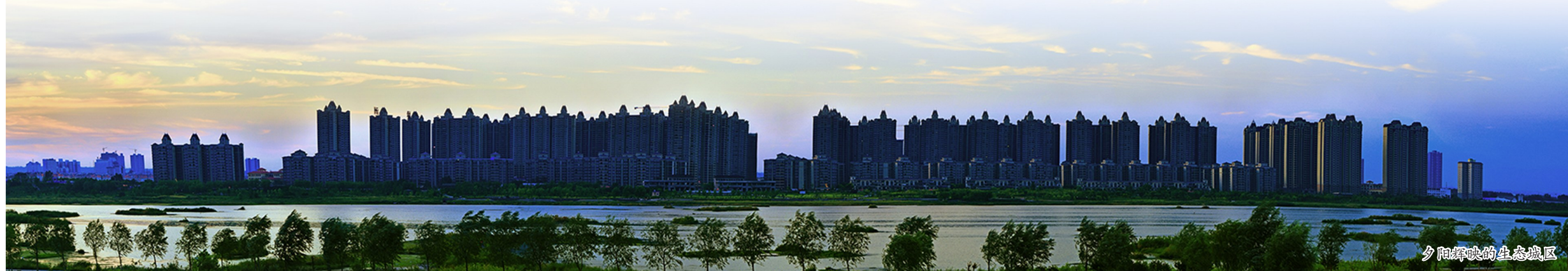
夕阳辉映的生态城区

形成现代化民族文化城区。依托少数民族区域特色和文化底蕴深厚的优势,积极推动东出口地块整体改造和东关大街南北两侧地块开发,全力打造宜居宜商现代化民族城区。 王少峰 文/图