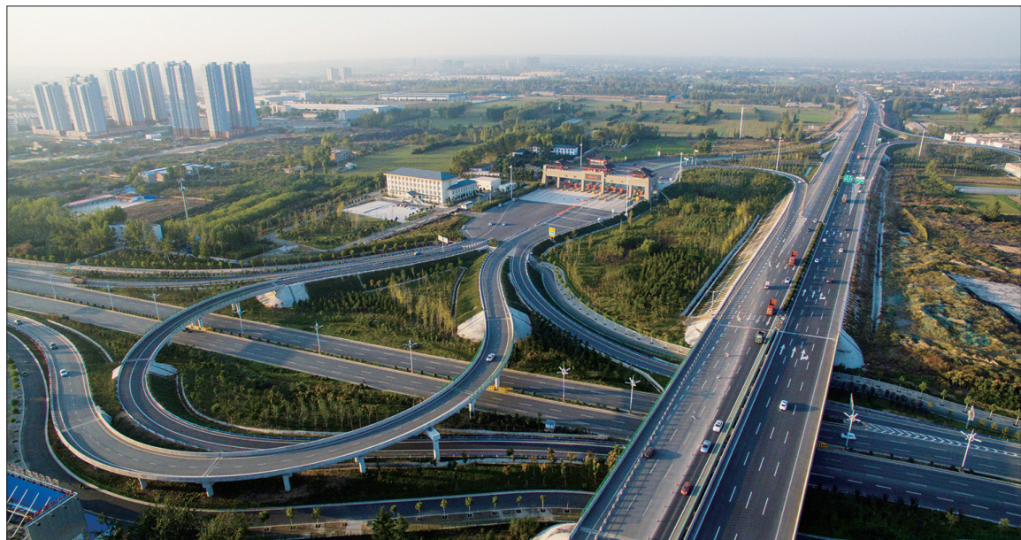
四通八达的洛阳“东大门”

洛阳,古丝绸之路的东方起点,千百年来,它同沿线国家和地区经贸往来、人文交流绵延不绝。瀍河,洛阳的“东大门”,在改革开放伟力的推动下,成为一片商机无限、潜力巨大的投资高地。位于洛阳市区东部的瀍河回族区,北依邙山,南濒洛河,是全国五个少数民族城区之一,辖区总面积41.7平方公里,全区有7个街道办事处、1个回族乡,30个社区,全区总人口19.6万人。