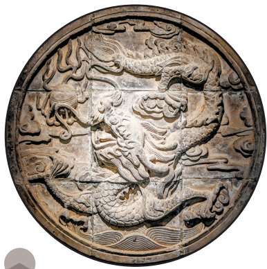
清代腾龙戏珠砖雕壁画