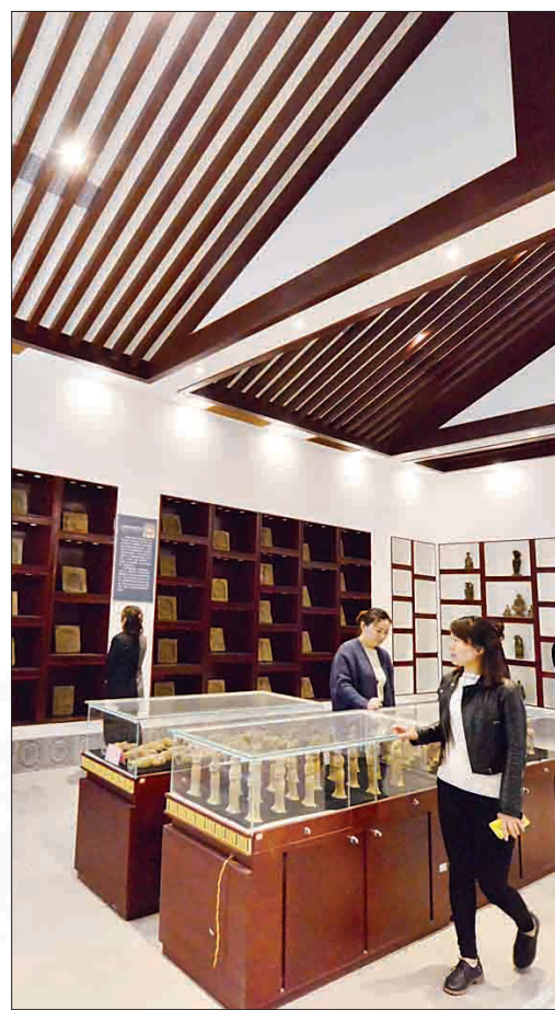
参观者在室内展馆欣赏展品

馆外展示区是上阳宫博物馆的重要组成部分,主要以大型石刻、铁器、陶器、造像碑为主,其中的唐代陀罗尼经幢、北齐菩萨残像等,都是不可多得的艺术珍品。