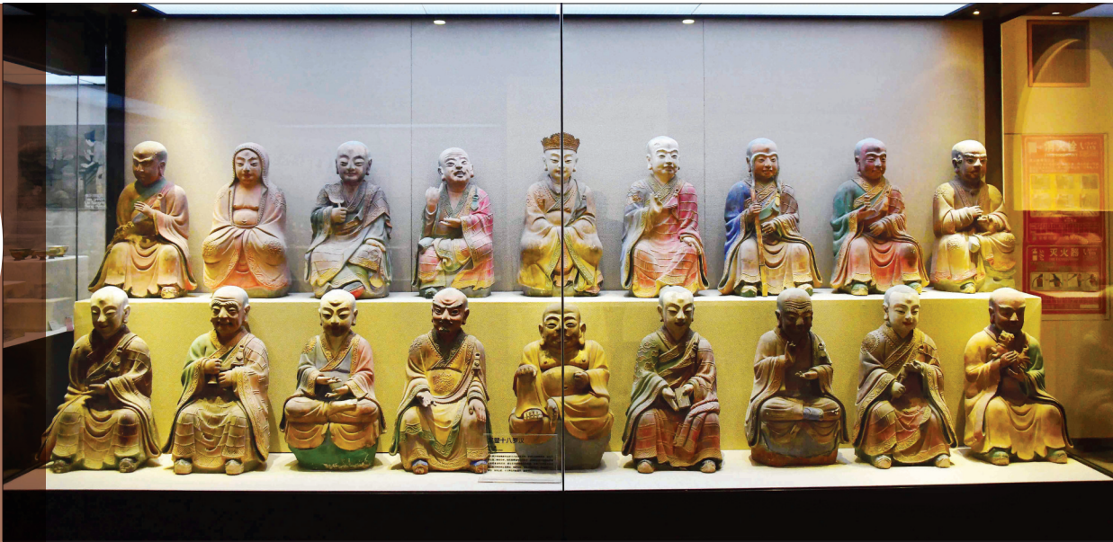
清代泥塑十八罗汉