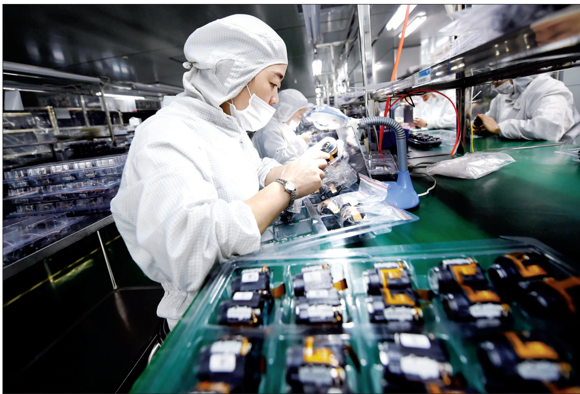
工人正在检查即将包装的镜头

“目前,我们和数十家全球知名相机制造商合作稳定,产品销售到日本、美国、德国等40多个国家和地区。”该公司负责人说,随着5G时代的到来,洛阳拜波赫也在走自主创新道路,努力让产品在无人驾驶、人工智能、航空航天等领域有更广泛的应用。本报记者 牛鹏远/文