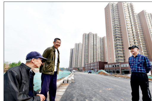
打通断头路 居民好出行

23日,记者在老城区经二路看到,经过施工人员的努力,经二路打通工程接近尾声,主干道已具备通行条件。该路段打通后,将进一步优化道北区域路网,方便附近居民生活出行。