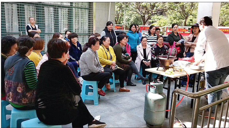
中式烹调班实操课培训现场

市人社局相关负责人表示,去年7月,市人社局、市财政局联合下发《洛阳市就业技能培训实施细则》,明确“五类人员”参加就业技能培训,可享受政府补贴。“五类人员”包括明确有劳动能力和就业(培训)愿望的贫困家庭子女(建档立卡及享受低保家庭的适龄劳动者)、毕业学年高校毕业生(含技师学院高级工班、预备技师班和特殊教育院校职业教育类毕业