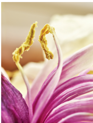
牡丹摄影作品(资料图片)