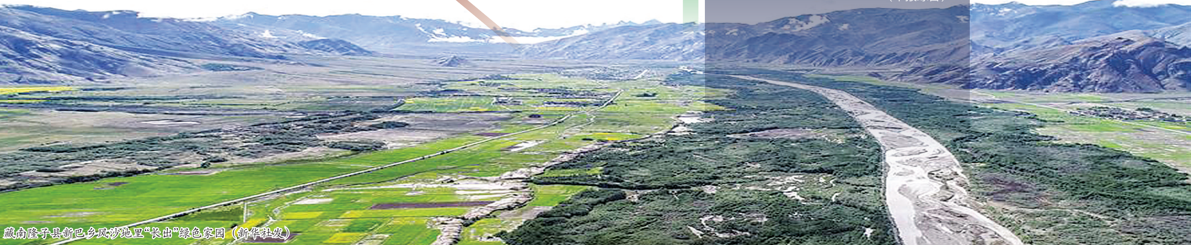
藏南隆子县新巴乡沙地里“长出”绿色家园

本版转载文章作者,请联系编辑 (电子邮箱:lyrbshb@163.com)告知地址,以奉稿酬。