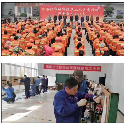
以上图片为洛阳工会部分活动现场