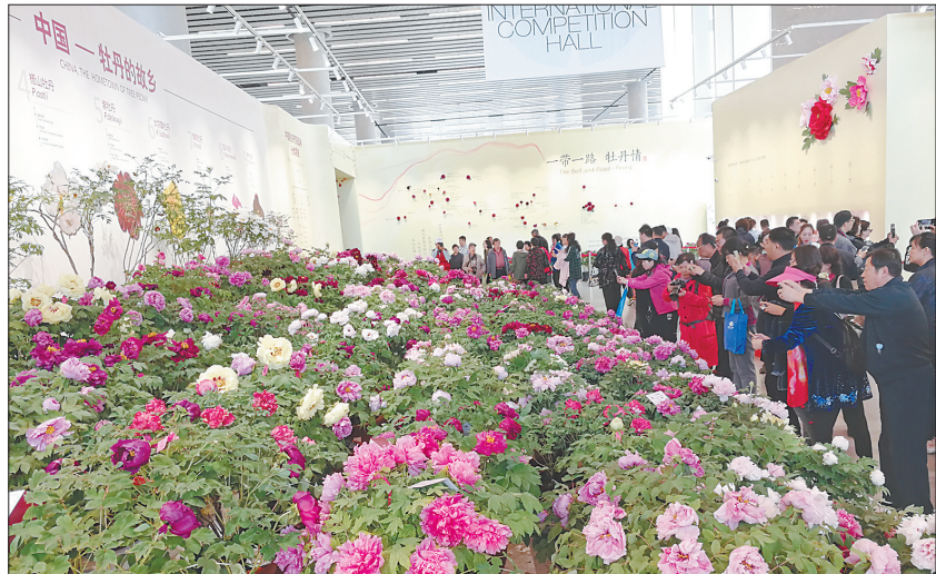
洛阳牡丹令参观者惊艳

国运昌时花运昌,太平盛世喜牡丹。在世园会上,从“锦绣如意”中国馆到多姿多彩的国际馆,从中华园艺展区到世界园艺展区,无论是集中展陈的牡丹主题观