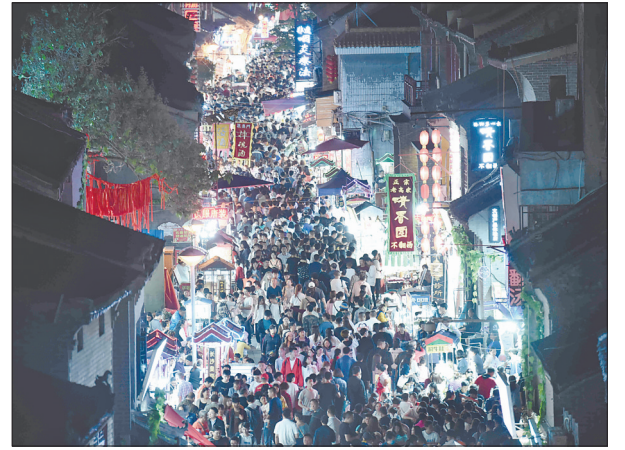
五一假期,老城西大街游人如织

本报讯(记者 常书香 通讯员 李文渊 周亚伟)五一假期,我市文化旅游消费旺盛——5月1日至4日,我市共接待游客320.55万人次,实现旅游收入31.57亿元,实现了旅游人次和收入双增长,并呈现多个亮点。(相关报道见03版)