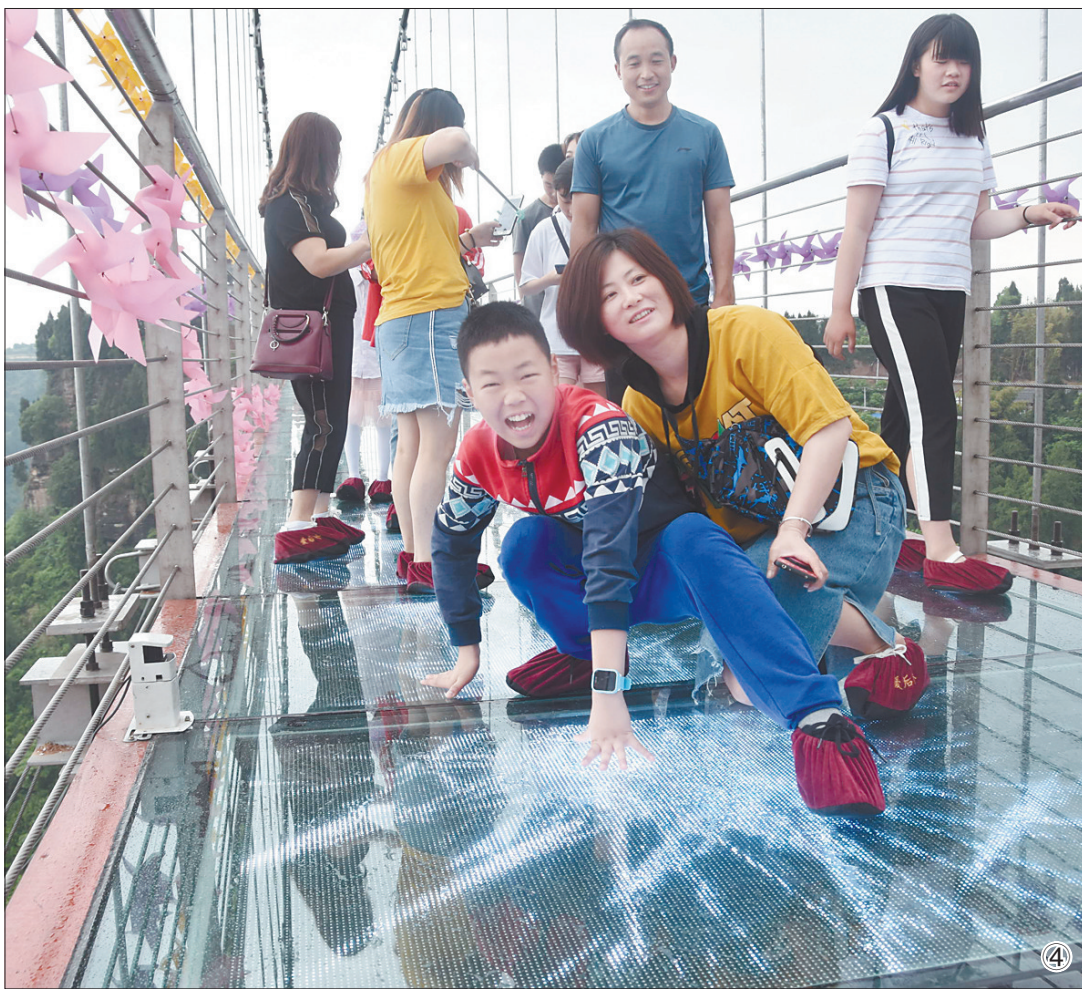
图① 5月3日,游客在浙江武义大斗山航空飞行营地体验空中游览。 图② 5月2日,游人在南京夫子庙景区游览。 图③ 5月3日,游人在山东台儿庄古城景区乘船观赏夜景。 图④ 5月2日,游客在四川省南充市蓬安县正源镇红豆村爱情公园5D玻璃吊桥上体验。

统计数据显示,五一劳动节假日四天,亲子、研学等形式的家庭游成为热点,拉动了文化、休闲、餐饮等消费。文化和旅游消费额在501元至1000元之间的游客比例最高,为38.0%;游客平均外出停留时间为2.25天,较清明假期增长9.5%。