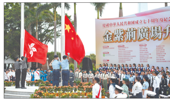
昨日,香港举行升旗仪式,庆祝新中国成立70周年及纪念五四运动100周年

据新华社北京5月4日电 记者4日从共青团中央获悉,今年五四青年节期间,各级共青团组织认真学习宣传贯彻习近平总书记纪念五四运动100周年大会上的重要讲话精神,广泛开展“青春心向党·建功新时代”主题团日活动。