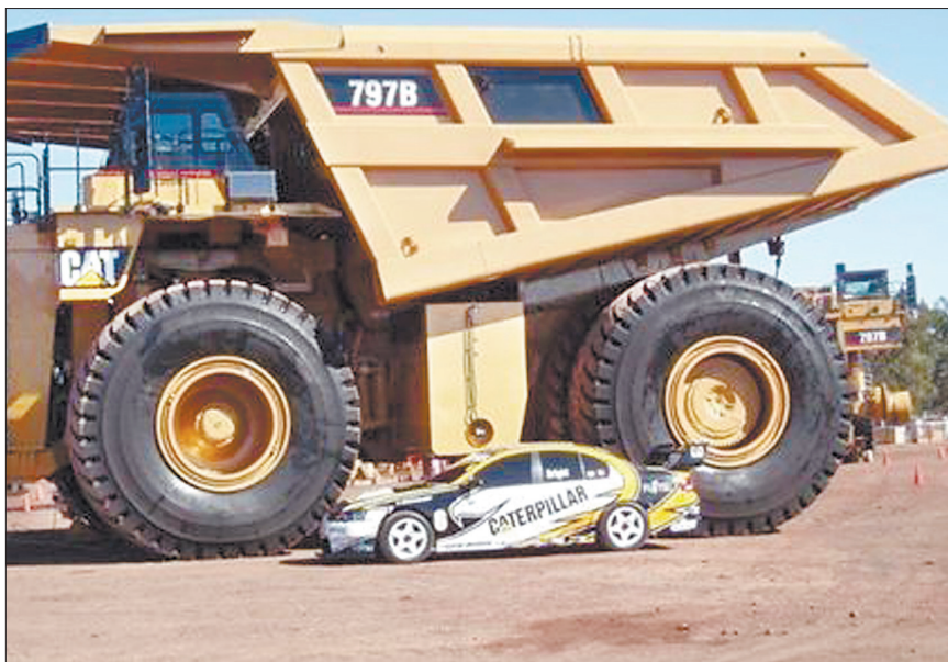
全球最大矿卡 (资料图片)

本报讯(记者 赵志伟 通讯员 徐海波)全球最大矿用卡车——卡特彼勒797矿卡后桥壳实现洛阳造! 昨日,一个简短的发货仪式在洛阳洛北重工机械有限公司加工车间内举行,一件长3.1米、宽1.59米、高2.1米,总重达8.85吨的矿卡后桥壳铸钢件顺利交付用户。世界500强美国卡特彼勒公司矿业全球采购部经理Scott Avis激动地说:“这件铸钢件背后,是洛北重工的辛勤付出,你们很棒!” 成立于1925年的卡特彼勒公司是世界最大的工程机械和矿山设备生产企业,其制造的797矿用卡车被誉为“行驶中的巨无霸”。这个“大块头”长15.7米,高度超过两层楼,最大载重量达420吨,相当